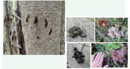
調べたもの：（上図左から）熊の爪、クマ （下図左から）クマの糞、カサ 「美の国あきたネット ツキノワグマ情報」より